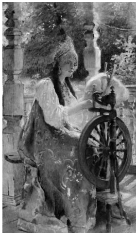
«За прялкой» Рис. 1

2.1. Из представленных ниже репродукций картин выдающегося русского художника К.Е. Маковского (1839 – 1915) выберите ту, на которой изображено протекание химической реакции.