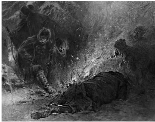
«Иван Сусанин» (фрагмент) Рис. 2