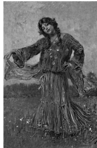
«Цыганка танцует» Рис. 3

Протекание химической реакции изображено на рисунке: