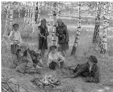
Н.П. Богданов-Бельский «У костра» Рис. 2