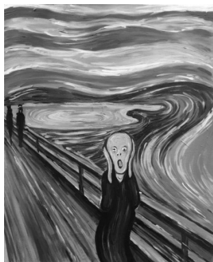
Эдвард Мунк «Крик» Рис. 1

2.1. Из представленных ниже репродукций картин известных мировых художников выберите ту, на которой изображено протекание химической реакции.