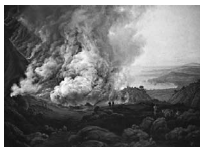
Ю.К. Даль «Извержение Везувия» Рис. 1

2.1. Из представленных ниже репродукций выдающихся произведений мировой живописи выберите ту, на которой изображено протекание химической реакции.