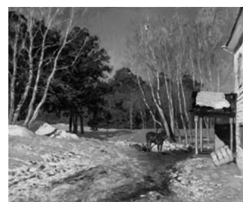
И.И. Левитан «Март» Рис. 3

Протекание химической реакции изображено на рисунке: