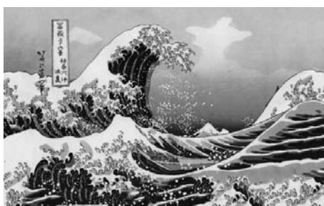
Кацусики Хokusай «Большая вода на Канагаве» Рис. 2