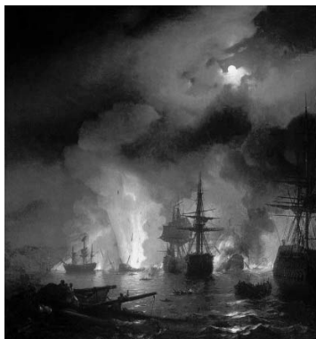
И.К. Айвазовский «Чесменский бой» Рис. 2