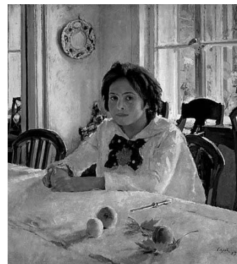
В.А. Серов «Девочка с персиками» Рис. 3

Протекание химической реакции изображено на рисунке: