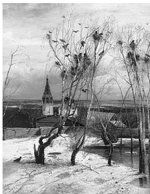
А.К. Саврасов «Грачи прилетели» Рис. 1

2.1. Из представленных ниже репродукций картин выдающихся российских художников выберите ту, на которой изображено протекание химической реакции.