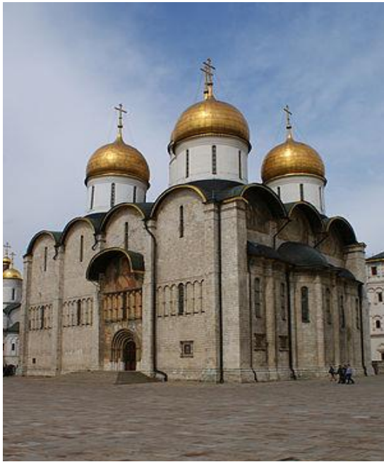
Архитектурный памятник 2