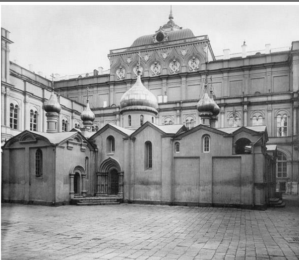
Архитектурный памятник 4