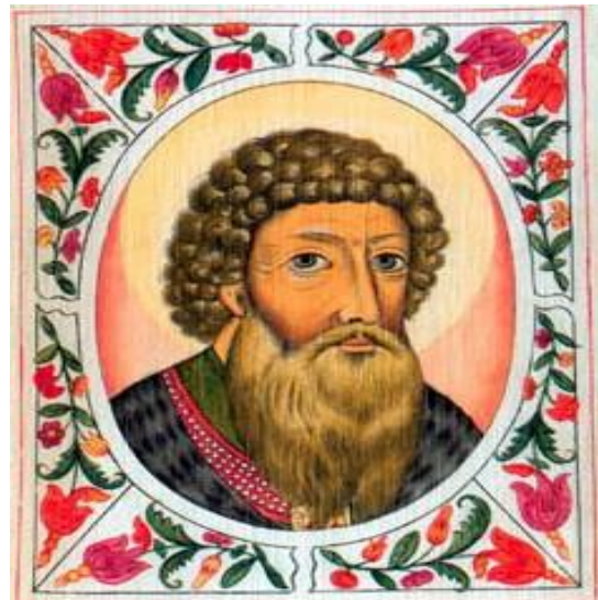
Историческая личность В