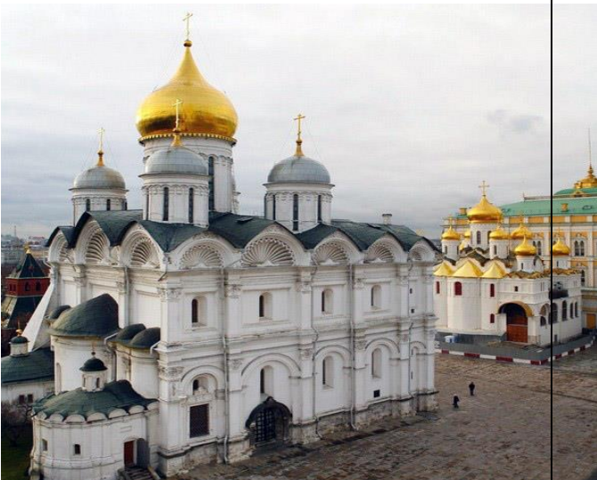
Архитектурный памятник 3