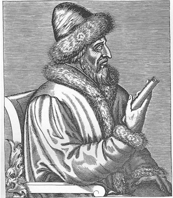
Историческая личность Б