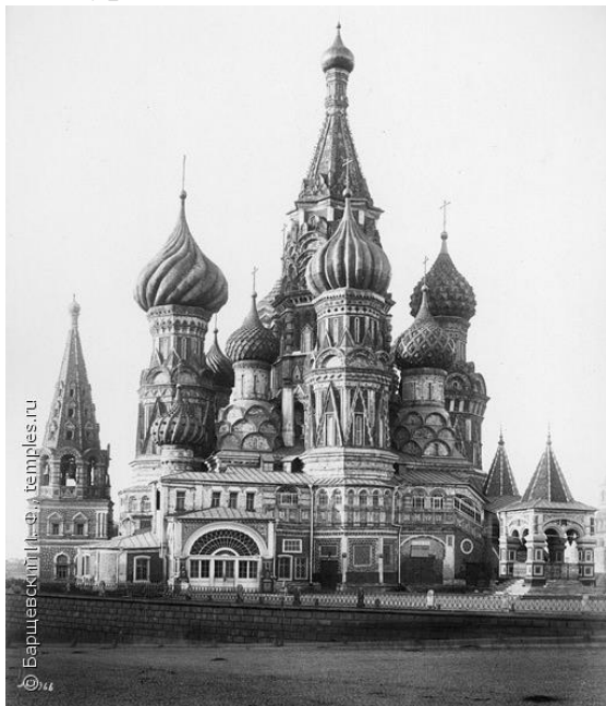
Архитектурный памятник 1